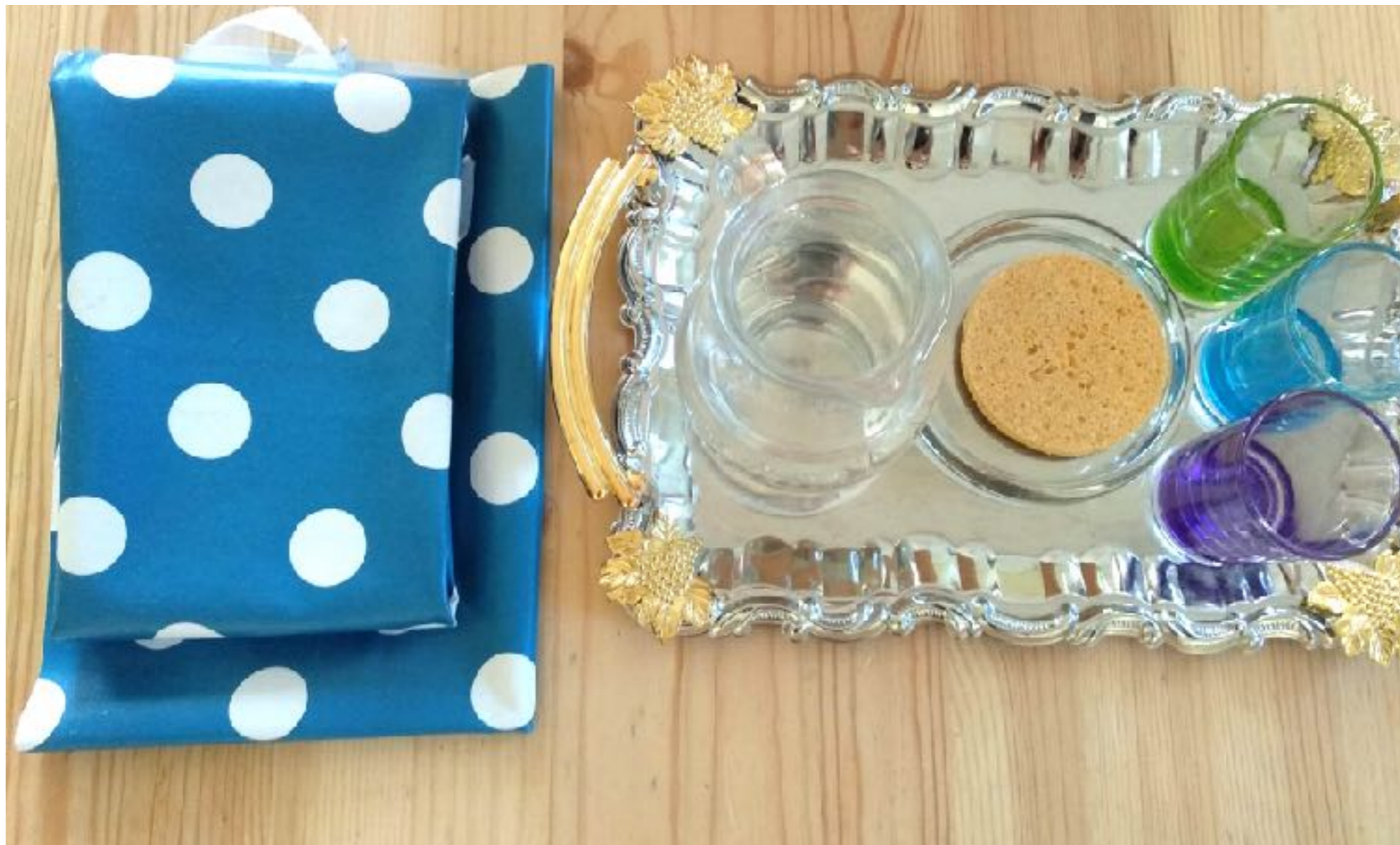
Переливание из кувшина в стакан